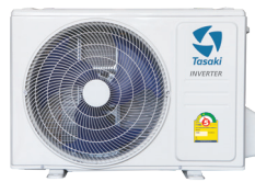
9,000 - 25,000 BTU/HR : CONDENSING UNIT